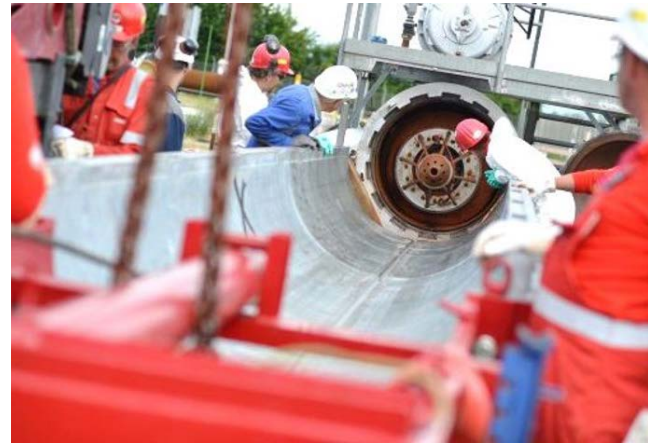
Molcheinbau und -ausbau erfordern besondere Aufmerksamkeit

Sehr gerne erstellen wir Ihnen ein individuelles Angebot, detailliert abgestimmt auf Ihre Anforderungen – wir freuen uns auf Ihre Anfrage!